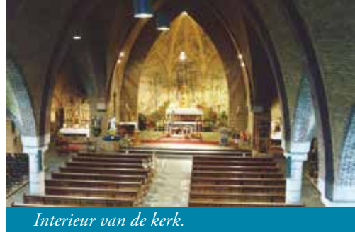
Interieur van de kerk.

uitgebeeld: de doop van Jezus in de Jordaan, en Mozes die met zijn staf water uit de rots slaat. Boven in het oksaal (achter in de kerk), zien we het Caecilia-raam.