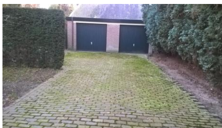
bestrating voor werkzaamheden

De bestrating voor de garages, aan de zijkant van de Pastorie, is de afgelopen weken geheel opnieuw gelegd. Door o.a de wortels van de bomen was de bestrating op diverse plaatsen omhoog gekomen. Dit leverde regelmatig struikelgevaar op. Afgelopen weken is de oude bestrating geheel verwijderd en is geheel opnieuw aangebracht. Hierbij zijn de bestaande stenen zoveel mogelijk opnieuw gebruikt.