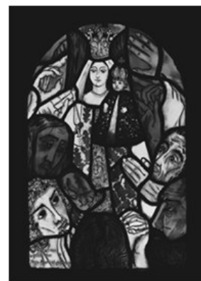
Glas in lood Mariakapel Westelbeers