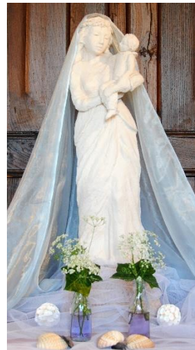
Mariabeeld in Oostelbeers