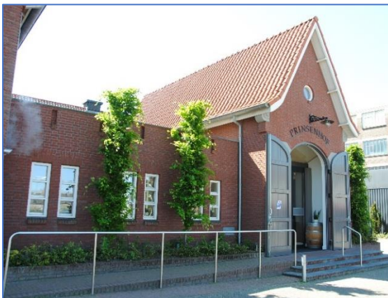
De Prinsenhof, Best

Vanwege het corona-virus gaat dit jaar het Parochieel Ontmoetings Triduium in De Prinsenhof niet door. Deze drie dagen voor de zieken uit de parochie worden elk jaar georganiseerd door een werkgroep die bestaat uit mensen uit elke geloofsgemeenschap. Elke dag begint met een viering waarin één van de pastores voorgaat en een koor zijn muzikale bijdrage levert. Na de maaltijd volgt er dan een ontspanningsprogramma. Het Triduium wordt de derde dag afgesloten met een ziekenzegen en handoplegging door het voltallige pastorale team van de parochie. De organisatie hoopt deze ontmoeting voor de zieken volgend jaar weer te kunnen realiseren.