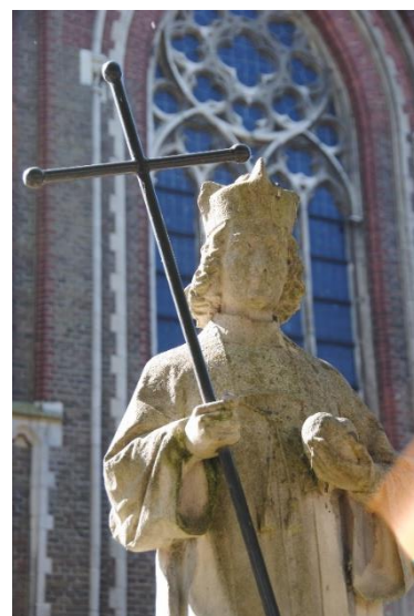
Sint Odulphus voor de kerk in Best

Pastoraal team en kosters Sint-Odulphus van Brabant