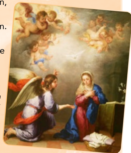
Schilderij: Een engel kondigt de geboorte van Jezus aan door Bartolomé Esteban Murillo rond 1655 - 1660

“Vrouw, zie daar uw zoon.” Tegen Johannes zegt Hij: “Zie daar uw moeder.” Vanaf dat moment neemt de leerling Maria bij zich in huis. Jezus geeft zijn leerlingen de opdracht om familie van elkaar te zijn. We horen bij elkaar zoals broers en zussen, neven en nichten bij dezelfde familie horen. Zo wordt Maria de moeder van de familie van Jezus. (Johannes 19, 24 b. - 27)