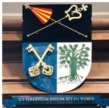
Het wapenschild in de Sint-Petrusbasiliek. In het schild zijn o.a. de Heilige Eik en de sleutels van Sint-Petrus afgebeeld.